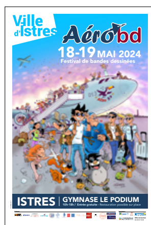
8 e édition 2024 Jean-Luc Garréra