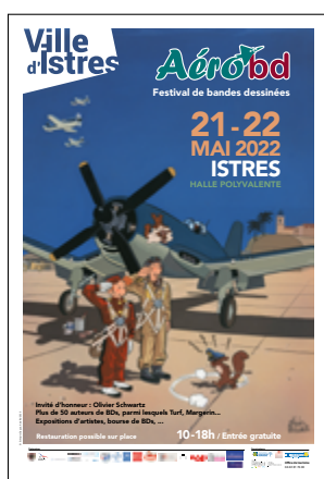
6 e édition 2022 Olivier Schwartz