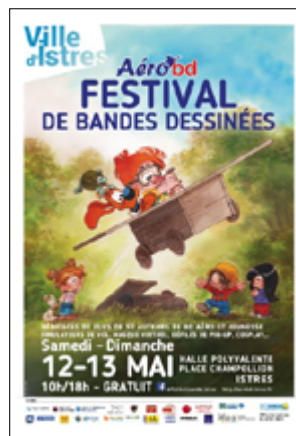
4 e édition 2018 Jean Bastide