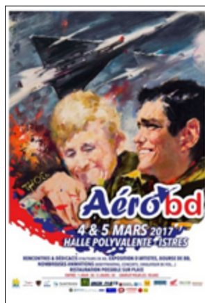
3 e édition 2017 Yves Thos