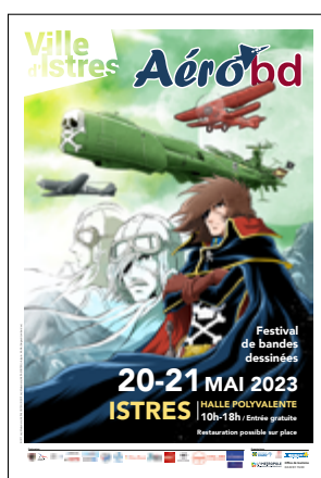
7 e édition 2023 Jérôme Alquié