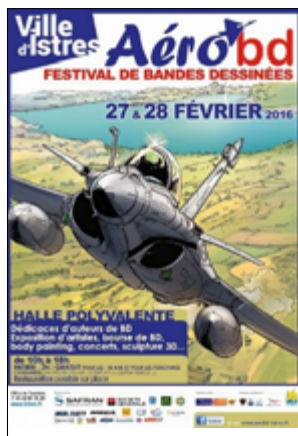
2 e édition 2016 Luc Brahy