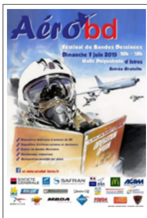
1 re édition 2015 Renaud Garreta