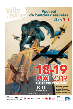
5 e édition 2019 Éric Herenguel