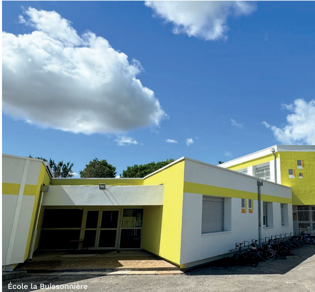
École la Buissonnière

Maire d'Istres Vice-président de la Métropole Aix-Marseille-Provence, délégué à la sidérurgie, à la pétrochimie et à l'aéronautique.