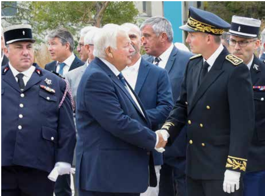
Lors de la prise de fonction du sous-préfet, Christophe Borgus, le 30 septembre 2024

Vice-président de la Métropole Aix-Marseille-Provence, délégué à la sidérurgie, à la pétrochimie et à l'aéronautique.