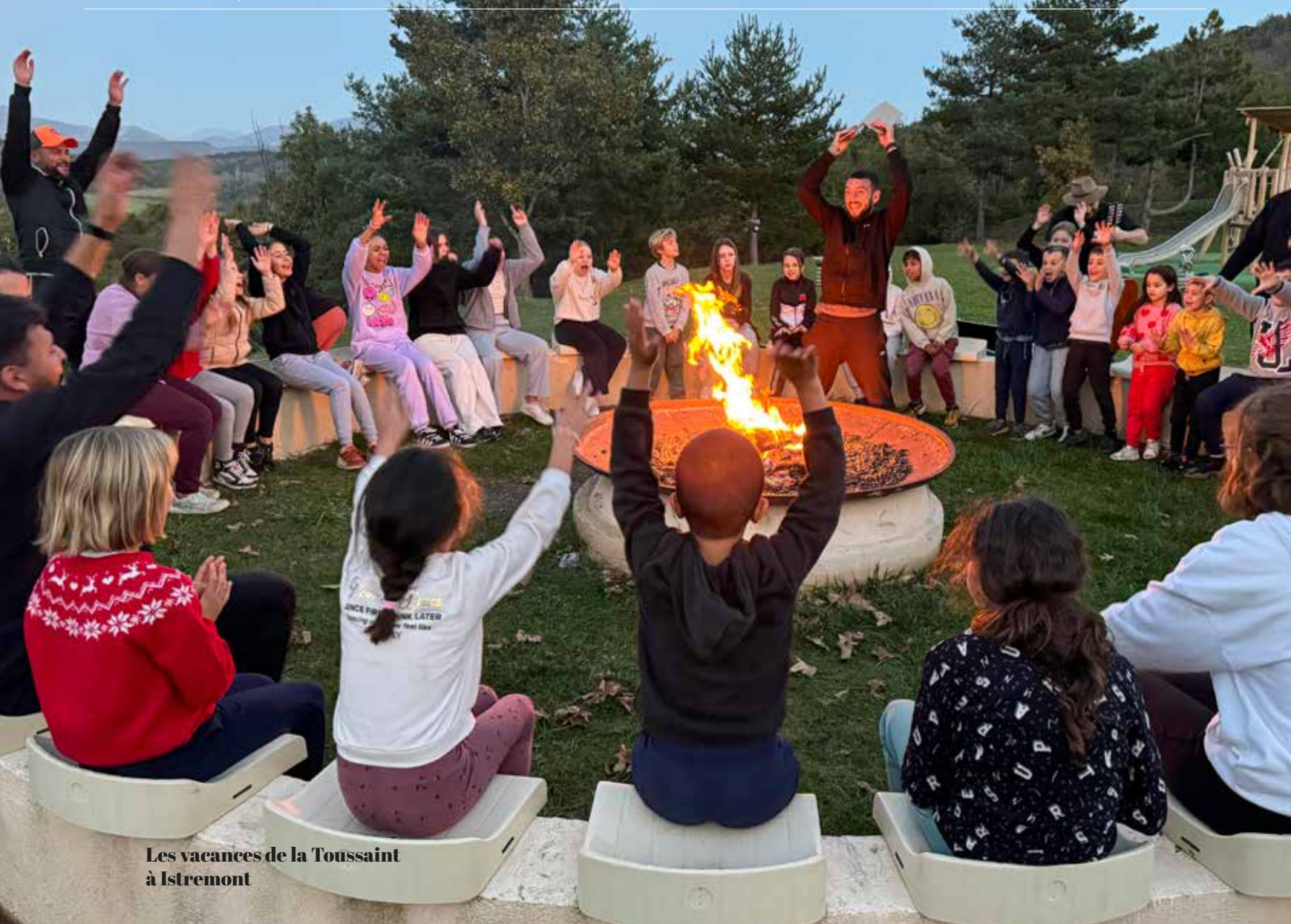
Les vacances de la Toussaint à Istremont