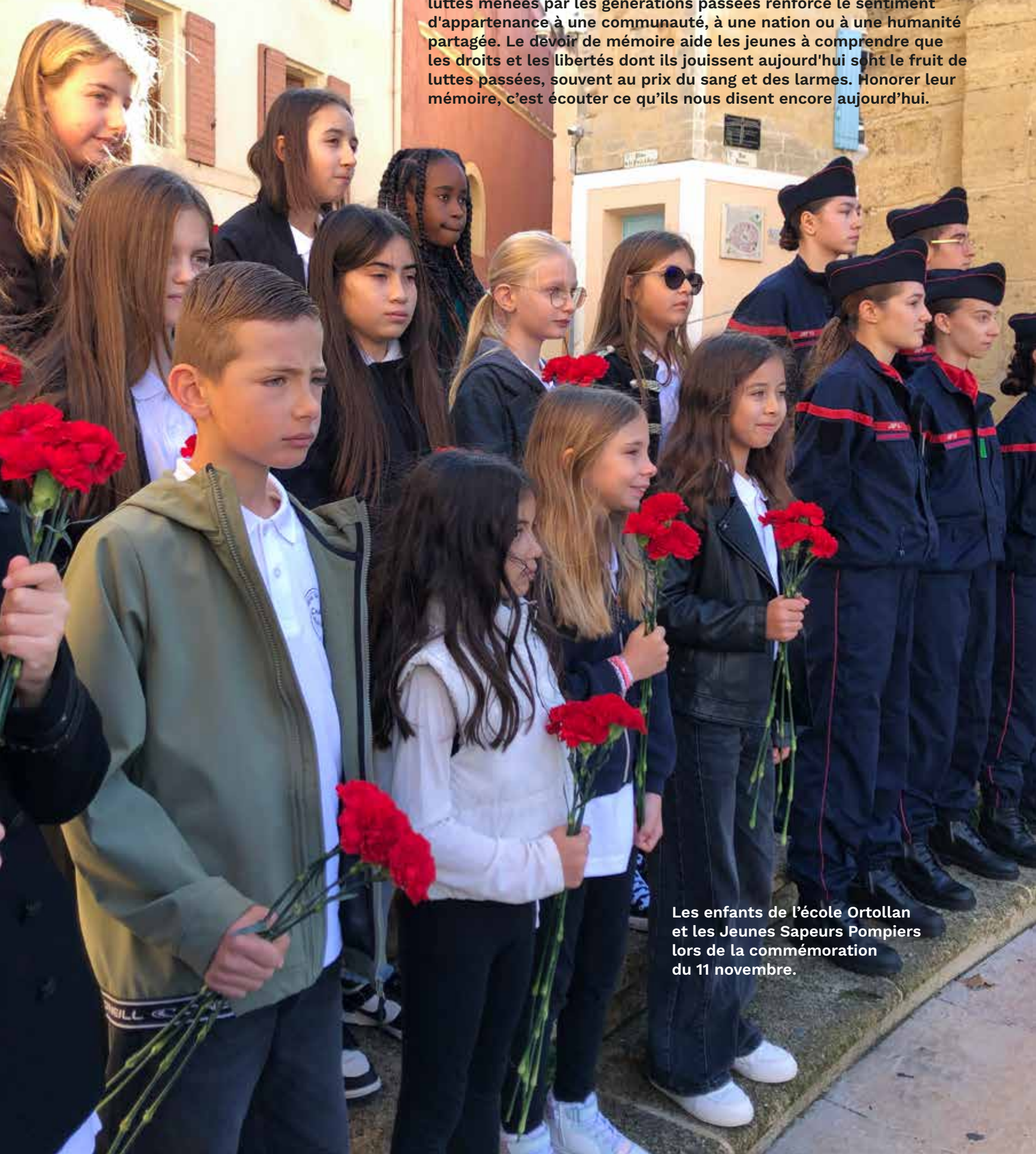
Les enfants de l'école Ortollan et les Jeunes Sapeurs Pompiers lors de la commémoration du 11 novembre.

Le 16 octobre, les 1 er et 11 novembre, Istres a rendu hommage aux héros « morts pour la France ». Se souvenir des sacrifices et des luttes menées par les générations passées renforce le sentiment d'appartenance à une communauté, à une nation ou à une humanité partagée. Le devoir de mémoire aide les jeunes à comprendre que les droits et les libertés dont ils jouissent aujourd'hui sont le fruit de luttes passées, souvent au prix du sang et des larmes. Honorer leur mémoire, c'est écouter ce qu'ils nous disent encore aujourd'hui.