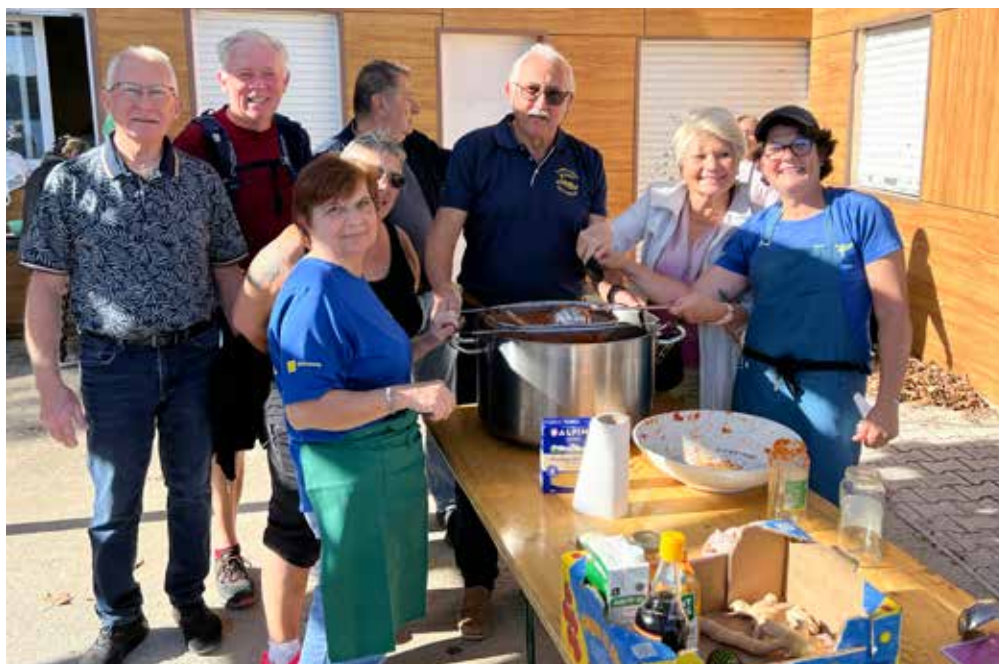
La ronde des soupes au bord de l'étang de l'Olivier

Il y a eu de la soupe de moules, de pois cassés, la chorba, l'harira, des soupes de légumes, au potiron, des potées, une soupe chinoise et bien d'autres ! De quoi se régaler pour l'ensemble des nombreux convives venus partager un moment de convivialité gourmand autour d'une bonne soupe dans les quartiers avec la complicité de la Ville.