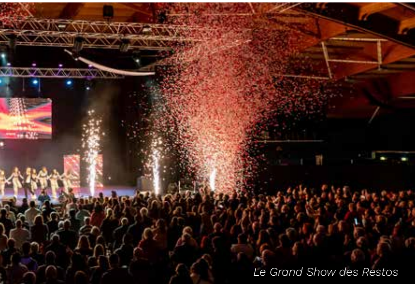
Le Grand Show des Restos